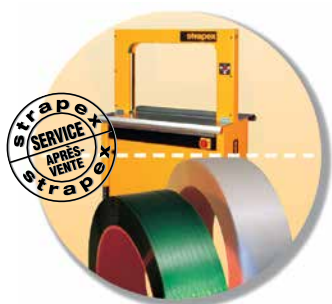
Le Service complet: Machine, feuillard et service après-vente