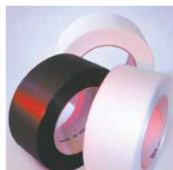
Des feuillards économiques pour un cerclage efficace Utilisation de feuillards PP de faible épaisseur