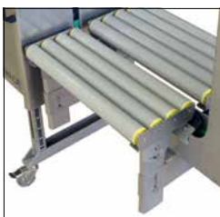
Options Adaptable aux situations générales d'exploitation et aux exigences particulières